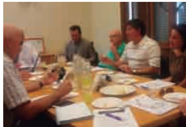
UGAR participa en el departamento PyMis de la UIC.