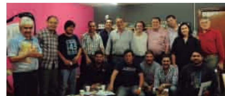
Reunión con colegas de Santiago del Estero.