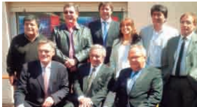
Presentación de Drupa en Buenos Aires.