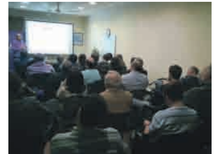
Jornadas de Educación Ambiental en Río Cuarto.