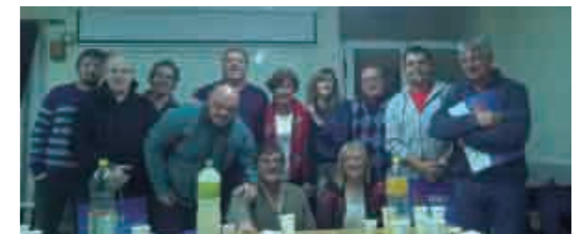
Reunión de gráficos en Río Tercero.