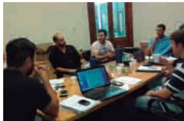
UGAR participa en el departamento Jóvenes de la UIC.

UGAR Regional Centro Noroeste participó con una mesa en la 9° edición del Coloquio Industrial de Córdoba, organizado por la Unión Industrial de Córdoba el 2 y 3 de agosto. El evento aglutinó bajo la convocatoria "Los desafíos de la industria" y estuvo enfocado en el análisis de las nuevas estrategias empresariales en tiempos de cambio en la economía global y de creciente deterioro de la situación económica local. En ese marco, el Departamento de Jóvenes Industriales de la Unión Industrial de Córdoba, donde UGAR participa activamente, organizó la 6° Conferencia de Jóvenes Empresarios "Innovación, la industria que viene".