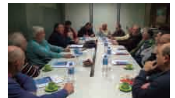
Reunión con colegas en San Francisco.